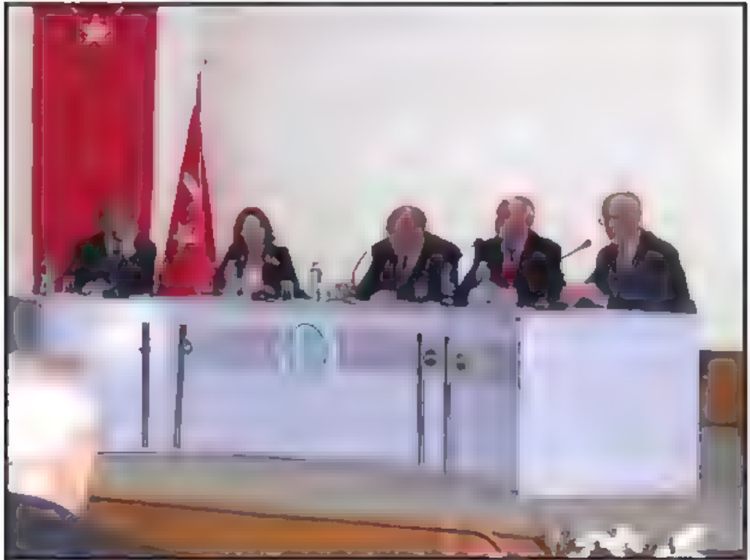
Dördüncü Oturum – Türk Dış Politikasında Temel Sorunlar